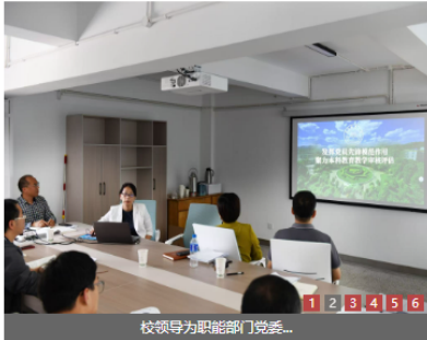
校领导为职能部门党委...